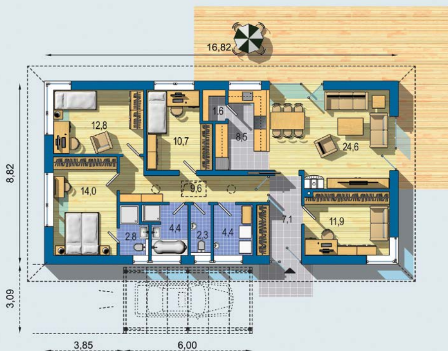
PŘÍZEMÍ [celková plocha 114.5 m 2 ]

Návrh dispozice půdorysu rodinného domu je architektonickým dílem podle § 2 odst.1 Autorského zákona č. 121/2000 Sb. Jeho porušení je trestné podle § 270 Trestního zákoníku č. 40/2009 Sb.